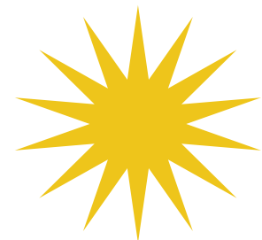
PERPADUAN 13 NEGERI & 1 WILAYAH PERSEKUTUAN